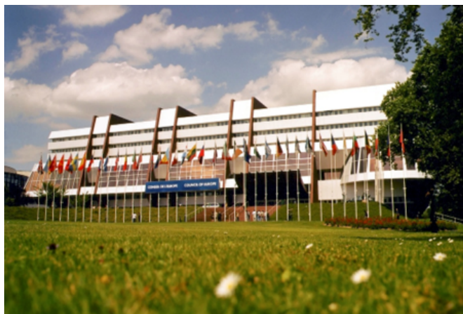
Fig. 2. Sede do Conselho da Europa em Estrasburgo https://upload.wikimedia.org/wikipedia/commons/d/d9/Council_of_Europe_Palais_de_l%27Europe.JPG

A Convenção-quadro de Faro surge como um lógico corolário da ação do Conselho da Europa. A partir de instrumentos já existentes, a nova Convenção conduzirá à troca de boas experiências e à difusão de modelos elaborados em comum. Numa sociedade marcada pela mudança a nova Convenção constitui um passo excepcionalmente positivo. E poderemos mesmo pensar num “Plano Europeu para a gestão durável dos recursos patrimoniais”, a partir do novo entendimento e dos novos compromissos. Perante a exigência do reconhecimento mútuo do património inerente às diversas tradições culturais que coexistem e de uma responsabilidade moral partilhada na transmissão do património às futuras gerações, realizamos um exercício prático, onde, a propósito da herança cultural e da salvaguarda de marcos de memória, descobrimos a importância do diálogo entre valores e factos, entre ideais e interesses, entre autonomia e heteronomia.