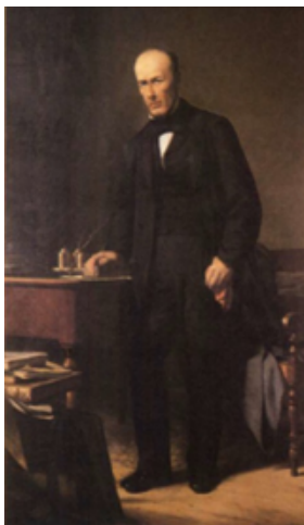
Fig. 1. Alexandre Herculano por João Pedroso

“Nossos pais destruíram por ignorância e ainda mais por desleixo: destruíram, digamos assim, negativamente: nós destruímos por ideias ou falsas ou exageradas; destruímos ativamente; destruímos, porque a destruição é uma vertigem desta época. Feliz quem isto escreve, se pudesse curar alguém da febre demolidora; salvar uma pedra, só que fosse, das mãos dos modernos hunos!”